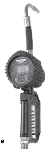
2833 Para Aceite