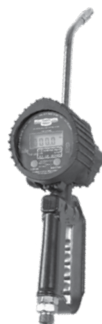
2826 Para Aceite 2830 Para Anticongelante