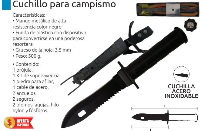
CUCHILLA ACERO INOXIDABLE