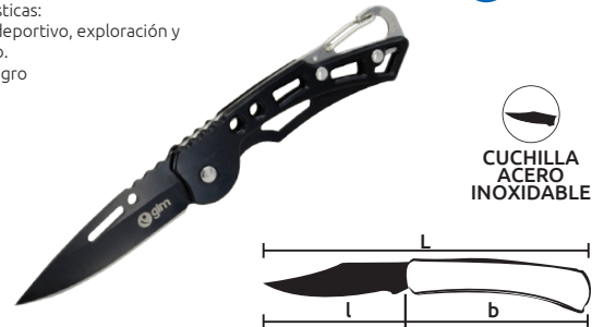
CUCHILLA ACERO INOXIDABLE