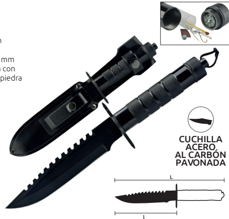
CUCHILLA ACERO AL CARBÓN PAVONADA