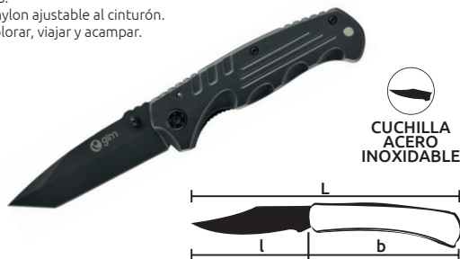
CUCHILLA ACERO INOXIDABLE