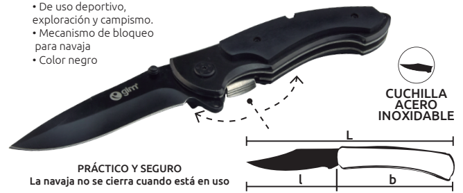
CUCHILLA ACERO INOXIDABLE

PRÁCTICO Y SEGURO La navaja no se cierra cuando está en uso