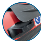
ASA PARA TRANSPORTAR