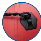
LÍNEA DE VIDA