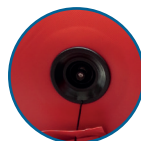
VÁLVULA DE AIRE