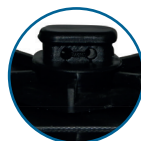
TAPÓN DE DRENAJE