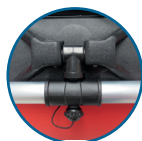
SOPORTE CON CERROJO